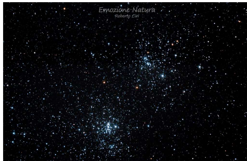
Ammasso doppio del Perseo NGC 869-884