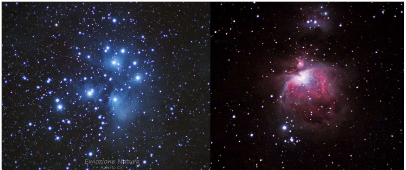
Pleiadi (M45) e nebulosa di Orione (M42)

Facebook: www.facebook.com/EmozioNaturaGAERobertoCiri