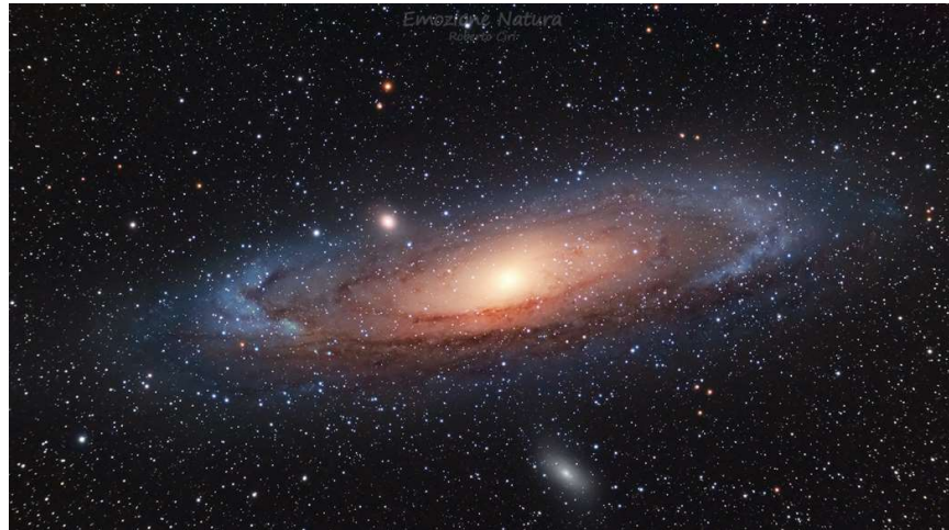
Galassia di Andromeda (M31)